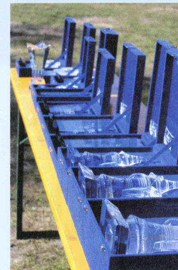
Palkinnot odottavat maalissa.

Matkaratsastus on lajina yhteisöllinen, sillä suoriutuakseen kilpailun rasituksista tarvitsee ratsastaja tuekseen osaavan tiimin, joka huoltaa niin ratsastajaa, kuin hevostakin ja lisäksi tarkkailee