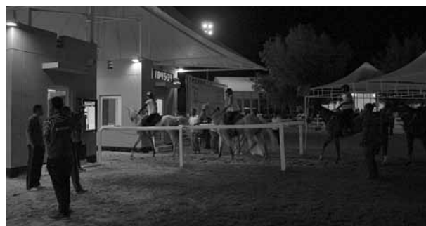
Yölliset matkajat lähdössä seuraavalle etapille.