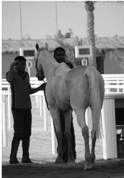
Jopa joidenkin kimojen valkeat jalat oli värjätty punaruskeiksi.

Bahrainilainen vieraanvaraisuus oli sen sort-tista, että mistään ei voinut kieltäytyä. Toiminta- ja käyttäytymistavat olivat euroop-palaisesta näkökulmasta vähän vieraat, mut-ta miehelle sopeutuminen arabimaiden ar-keen onnistuu varmasti vähän helpommin kuin naisilta. Naisia ei kilpailupaikalla mon-taa näkynyt, sillä laji on puhtaasti miesten hallitsema. Osallistujalistalta löytyi kuiten-kin muutama nainen, mutta he olivat Euroo-